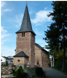
St. Pantaleon Satzvey