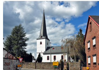
St. Stephanus Lessenich