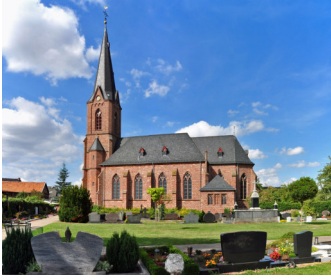
St. Hubertus Obergartzem